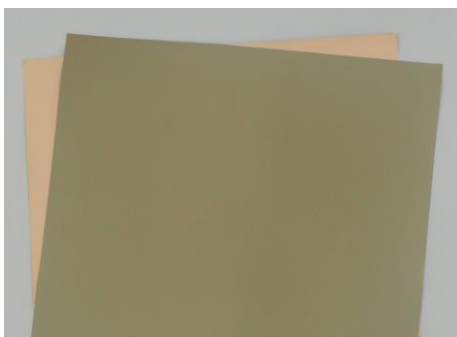
LPC フレキシブル銅張積層板